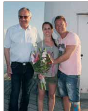
Bgm. RegRat mit den Verlobten.