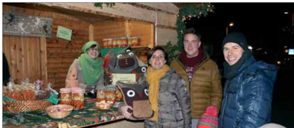
Gute Stimmung am Adventstand