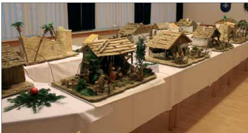
Krippenausstellung im Sitzungssaal